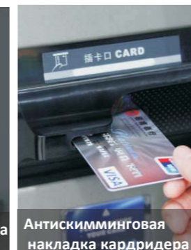
Антискимминговая накладка кардридера