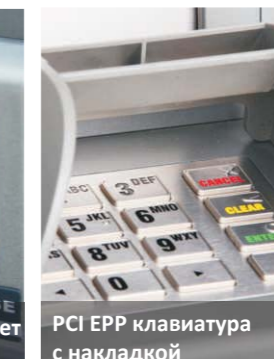
PCI EPP клавиатура с накладкой