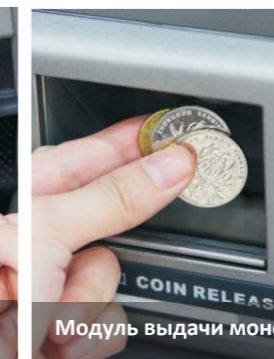
Модуль выдачи монет