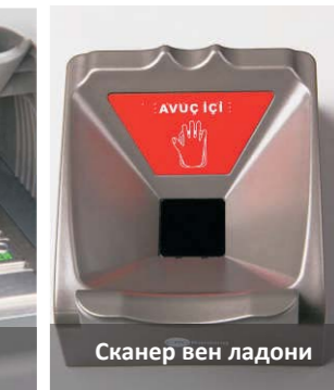
Сканер вен ладони